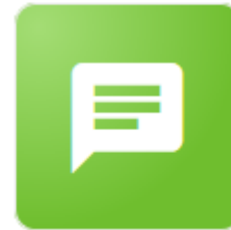
Carnet de liaison